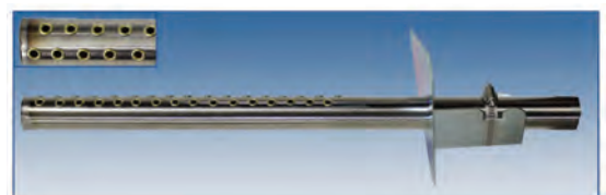
S.A.M.E2: SKR14 et SKR25